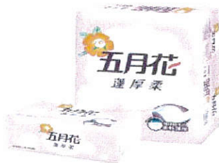
五月花頂級抽取衛生紙