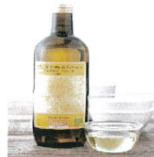
有機義大利高燃點葵花籽油