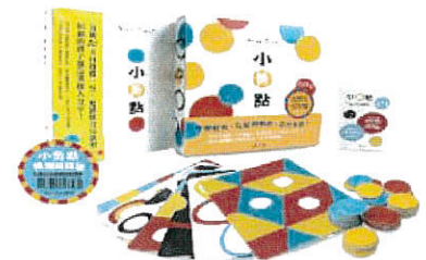
小黃點暢銷回饋版